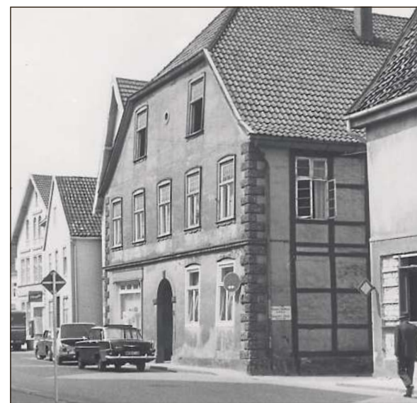
Zwischenstation: Durch den Erwerb des Hauses von Luise Giercken an der Langen Straße (später Schönnell) bekommt die Stadtschule mehr Platz.