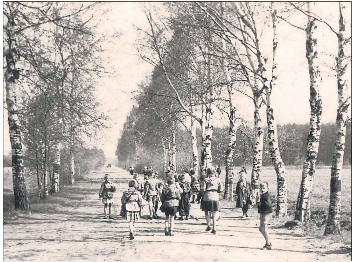
Lernen auf dem Land: Birken säumen den Schulweg der Kinder aus Nordrheda-Ems. Bis 1966 hat die Bauerschaft eine eigene kleine Schule. Vor dem Bau des Gebäudes unterrichtet der Lehrer die Jungen und Mädchen in einem Zimmer des Hofes Emsmann.