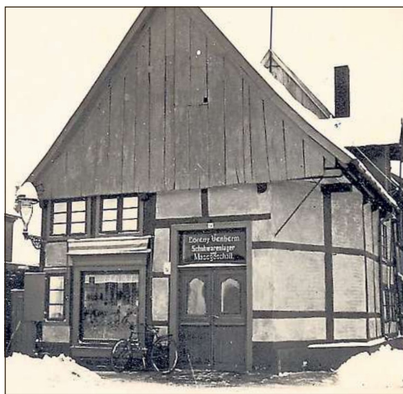
Keimzelle: Im Küsterhaus gibt es ab 1608 die erste Schule für die Rhedaer Stadtkinder. Später beherbergt das Haus das Schuhgeschäft Lorenz Venherm.

Nur in der Zeit des Nationalsozialismus' heißt die Wenneberschule an der heutigen Berliner Straße nicht nach ihrem Stifter. 1939 hebt das NS-Regime die konfessionellen Volksschulen auf. In Rheda werden als Ersatz zwei Schulbezirke gebildet. Die Kinder besuchen entweder die Emst- oder die Lindenschule. Letztere erhält 1945 ihren ursprünglichen Namen zurück.